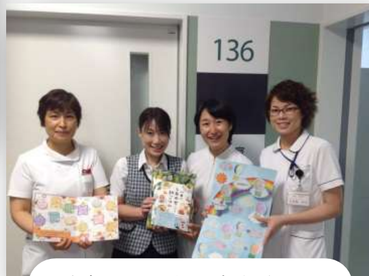
外来新設鍼灸治療室にて